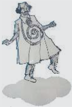
Светислава Булета Гонцића